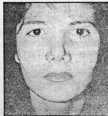
Patientin nach einem Unfall – und zwei Jahre später