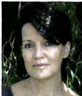
4Minutes Lift nun auch in Österreich erhältlich

Ein Baum überlebt in der Wüste selbst unter trockensten Bedingungen. Sein Geheimnis sind bestimmte Stoffe in seinen Zellen; diese sorgen dafür, dass grosse Mengen Feuchtigkeit gebunden werden, so dass die Pflanze auch unter extremsten Bedingungen vor dem Austrocknen geschützt ist. Dieser Kunstgriff der Natur, lebensnotwendige Feuchtigkeit zu speichern, beeinflusste die Entwicklung von 4 Minutes Lift wesentlich. Mit neuen Forschungstechniken konnten schließlich die Stoffe aus den Wüstenpflanzen nachgewiesen und isoliert werden. Eingearbeitet in Pflanzencremes haben sie die gleiche sensationelle Wirkung wie im Wüstenbaum.